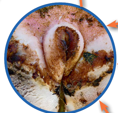
M4: Stade chronique, aspect de chou-fleur, guéri uniquement à la surface, bactéries en profondeur